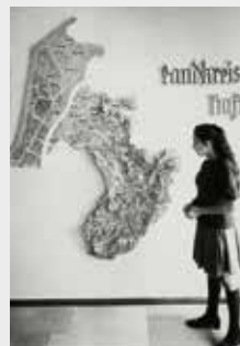
Relief des alten und neuen Landkreises (mit Stadtkreis Baden-Baden).

Camill Wurz, langjähriger Landtagspräsident und Landtagsabgeordneter für den Wahlkreis Baden-Baden, hatte zunächst erfolgreich einen Landkreis Baden-Baden gefordert und dabei drei Varianten in die Diskussion gebracht, die allesamt Baden-Baden als Kreissitz vorsahen. Aber die zweite und die dritte Lesung im Landtag zum Kreisreformgesetz fixierten zunächst eine Zuordnung der Kurstadt mit deutlicher Mehrheit nach Rastatt.